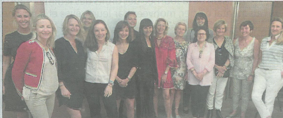
La délégation FCE du Golfe de Saint-Tropez.